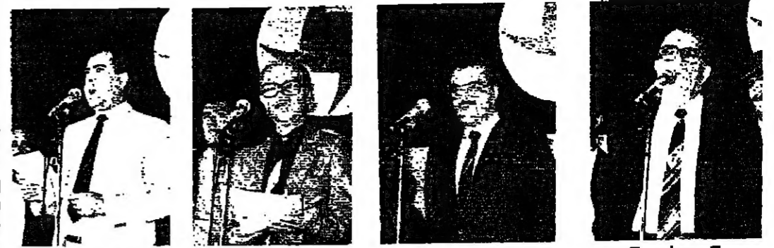
طرابلس - من كمال حيدر: مهرجان الذكرى الخمسة والثلاثين لتأسيس الحزب القومي السوري...